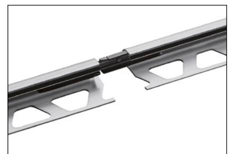
Schlüter®-RONDEC-AV (Empalme para perfiles de aluminio)